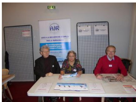
Les bénévoles d'AJR au forum social

Cette manifestation a aussi été l'occasion idéale de nouer des contacts et de rencontrer des bénévoles potentiels prêts à s'engager pour renforcer le tissu associatif très riche de la commune.