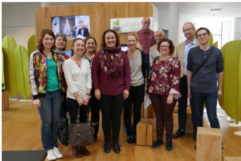
Les filleuls d'AJR à Cap Métiers Nouvelle Aquitaine

Bref, tout est réuni à Cap Métiers Nouvelle Aquitaine pour redynamiser sa recherche, la « bousculer » parfois, mais pour le meilleur. C'est à nos yeux, pour tout chercheur d'emploi, un passage certes non obligé, mais hautement souhaitable.