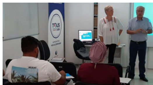
Réunion d'accueil des bénéficiaires du RSA

De haut en bas: Le Taillan Médoc, Saint-Aubin de Médoc, Mérignac, Saint-Médard-en-Jalles