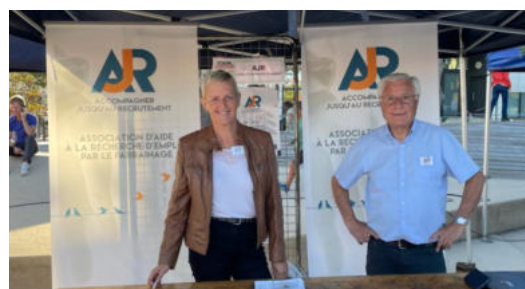
Forums des associations

De haut en bas: Le Taillan Médoc, Saint-Aubin de Médoc, Mérignac, Saint-Médard-en-Jalles