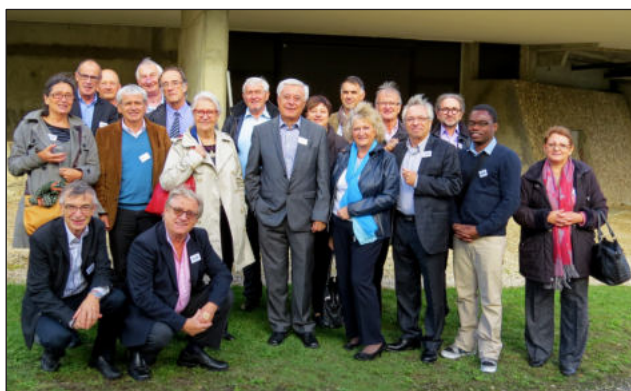
Talence - 2014