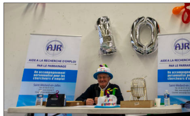
Salle Louise Michel, Saint-Médard - mars 2020