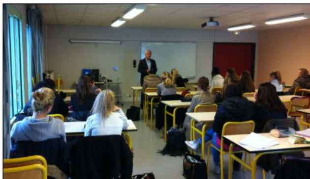
Lycée Jehan Duperier - novembre 2015