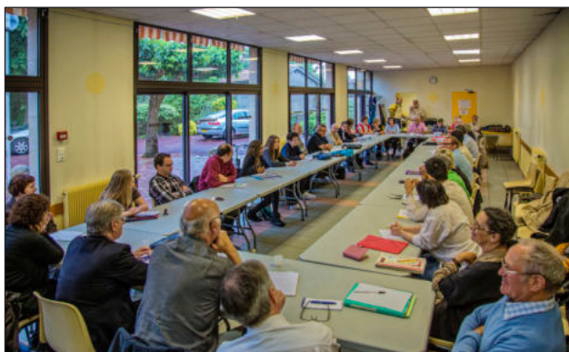
Le Taillan - mai 2013