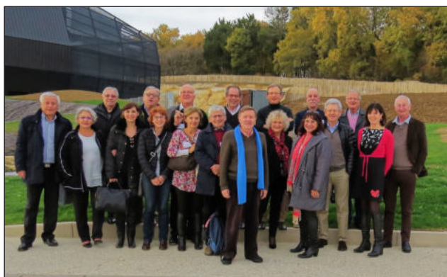
Jonzac - novembre 2017