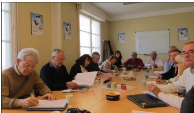
Saint-Médard - avril 2018