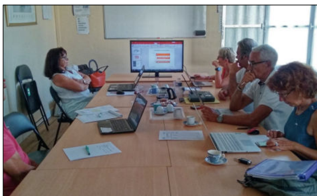
Atelier LinkedIn - 2019