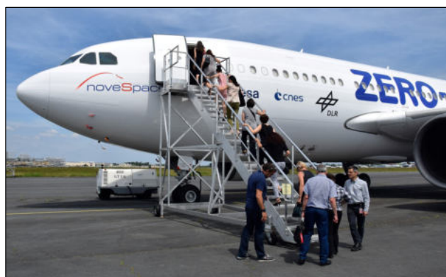
Visite Novespace - juin 2016