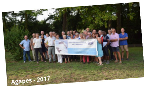
Agapes - 2017

Mise en place des séances de Sophrologie