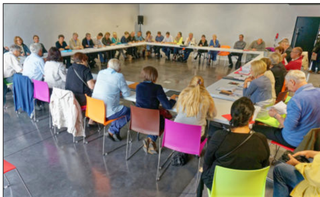
Salle Cap Ouest, Saint-Médard - septembre 2013