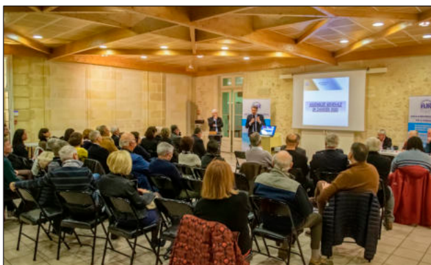
Club House, Saint-Médard - janvier 2020