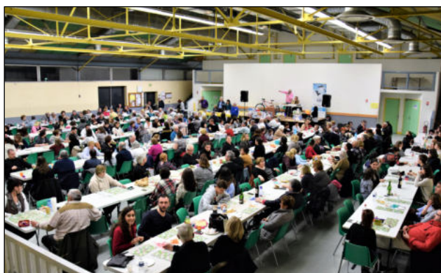
Salle Louise Michel, Saint-Médard - mars 2019