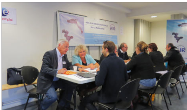
Direct Recrutement Saint Médard - octobre 2015